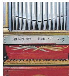
Storia della musica Alcuni pezzi della mostra "Chimere musicali-Strumenti rari dall'antichità all'800", a villa Fabri fino al 3 settembre

■ Oggi alle 11,30 a Trevi l'inaugurazione della mostra dedicata agli strumenti antichi. La decima edizione dell'evento si svilupperà anche a Spello e Acquasparta